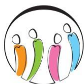
Mikhak Drop In Center

فعالیت های سال گذشته مرکز میخک به اختصار عبارت است از: